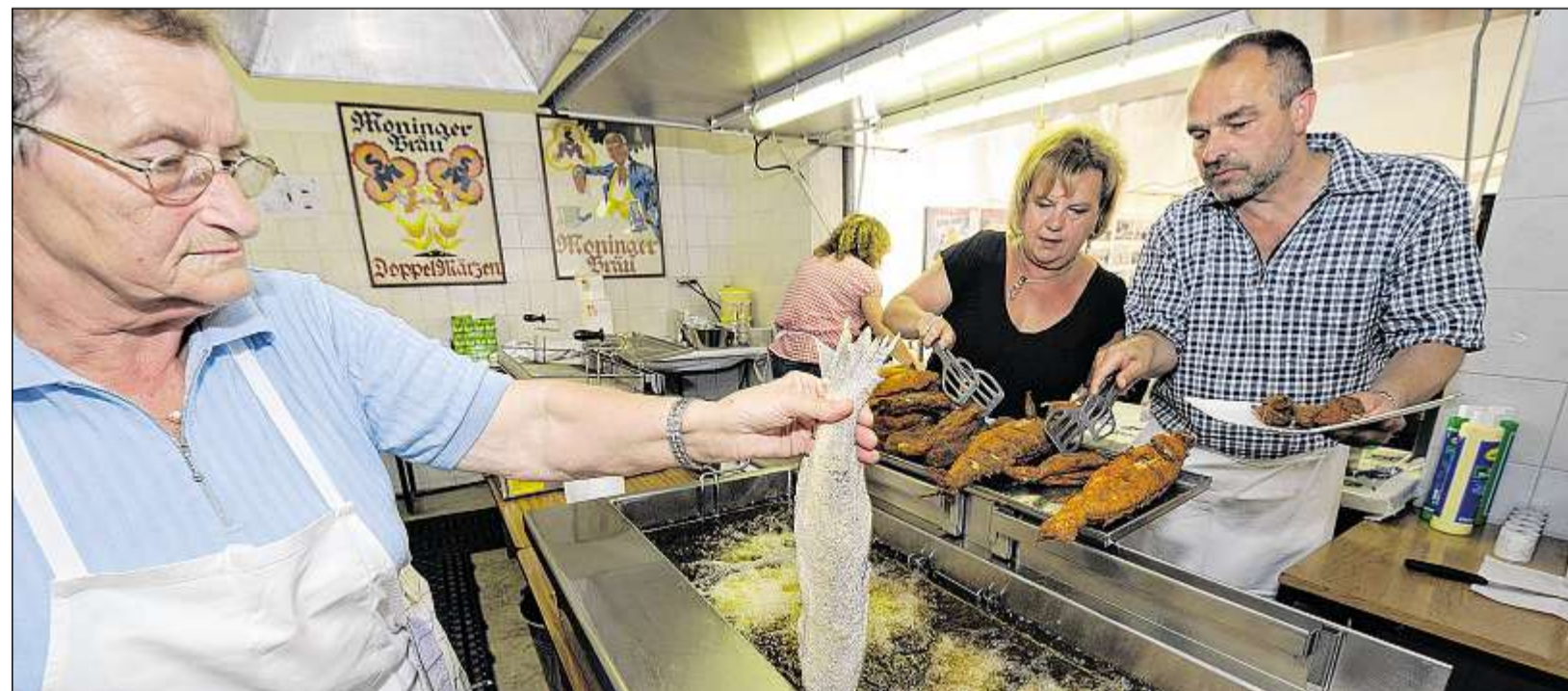
KOPFÜBER IN DIE FRITTEUSE: Ein Team der Knielinger Sportfischer bereitet die Fische für die Gäste vor. Noch bis Sonntag dauert das Knielinger Fischerfest, bei dem heute und morgen befreundete Vereine um Pokale beim Hegefischen im vereinsigenen See kämpfen.

Im Vordergrund steht die spannungsgela- dene Geschichte um vier Ninja-Lehrlinge, die im alten Japan den Kampf gegen das Böse aufnehmen und dafür die traditionsreiche Kampfkunst Spinjitzu erlernen müssen. Das Flair der fernen mythischen Welt zieht sich dabei wie ein roter Faden durch die Spielsta- tionen der Roadshow: Höhepunkte sind der Bau des mehr als zwei Meter großen Kai aus Lego-Steinen und die Ninjago-Spinjitzu- Turnier-Ecke, in der Geschicklichkeit gefragt ist. BNN